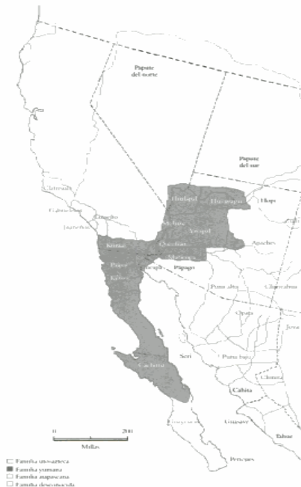
Territorios tradicionales indígenas del suroeste occidental

Los Kumiai han sido el grupo indígena más numeroso en esta región, ocupando un extenso territorio que cubre el actual condado de San Diego y parte del Valle Imperial, en Estados Unidos y los municipios de Tijuana, Playas de Rosarito, Tecate y partes de Mexicali y Ensenada en la República Mexicana. Hacia el sur, sobre la costa del Pacífico, ocuparon hasta el área de la antigua misión de Santo Tomás y al sureste hasta Santa Catarina.