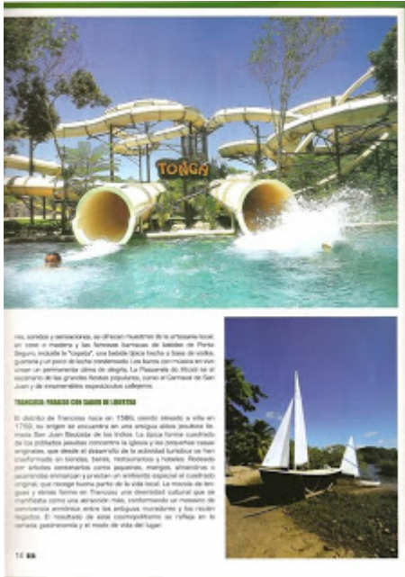
Revista Futurismo (Porto Seguro, Brasil) Etnoturismo o El Parque Temático del Indígena