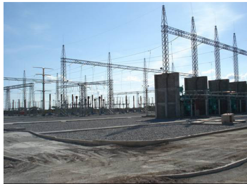
Figura 6.- Subestación eléctrica La Venta II 230 kV

Cada uno de los sistemas cuenta con elementos de monitoreo, supervisión y control, local y remoto (ubicado en la ciudad de Juchitán, a 30 km aproximadamente de la central) los cuales emiten señales que se concentran a través de estaciones de supervisión dedicadas, local y remota; así mismo se tienen enlaces de comunicaciones para el Centro Nacional de Control de Energía (CENACE) de la CFE, para la supervisión y control de la central.