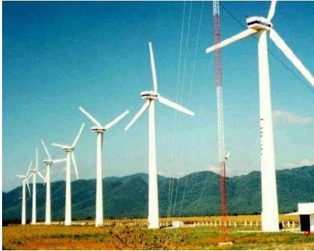
Figura 1.- Central eólica piloto La Venta 1,575kW

La primera experiencia que se tuvo en la CFE con el viento como fuente de energía, se dio en 1994 [1], cuando se construyó y se puso en servicio la central eólica piloto de La Venta, en el estado de Oaxaca (Ver Figura 1). Los registros de producción de la central piloto fueron sobresalientes, con un factor de planta mayor de 50% para el primer año de operación y un promedio de 40% para los diez años que ha estado en servicio. Esta central piloto inició su operación con siete aerogeneradores de 225 kW cada uno, instalados sobre torres tubulares de 30 m de altura, para una capacidad total de 1.5 MW.