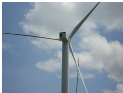
Figura 4.- Aerogenerador 3 palas eje horizontal con torre tubular.

La capacidad promedio de los aerogeneradores que se instalaron en el mundo en el año 2003 fue de 1.2 MW por unidad. En Alemania ésta capacidad promedio fue de 1.6 MW. La tendencia mundial es producir cada vez unidades de mayor capacidad con el propósito de utilizar menores extensiones de tierra por kW instalado. Actualmente la industria está transitando de la producción de aerogeneradores clase megawatt a los aerogeneradores clase multimegawatt, y se están instalando unidades prototipo de 5 MW, con diámetro de rotor de 126 metros y torre soporte de altura similar.