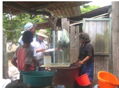
Figura 15-16. Personal de la malaria en labores de fumigación y abatización, isla Costa Rica, 2007