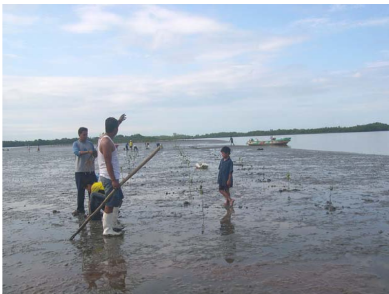
Figura 14. Minga (estudiantes y pescadores) de reforestación en el sector Los Puercos (isla Costa Rica), 2008.

- También en este año 2008 se realizó una minga de reforestación con estudiantes de la misma escuela y pescadores artesanales de esta isla, en el sector de Los Puercos donde se reforestaron 6 ha de mangle rojo ( Figura 14 ).