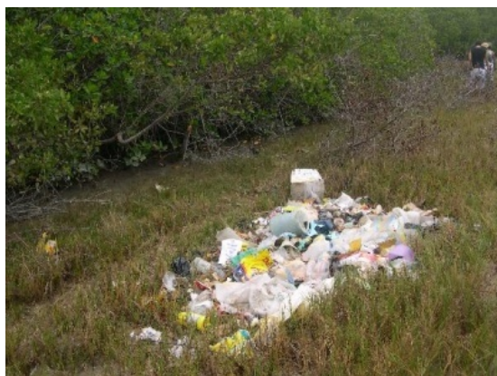
Figura 11-12. Micro-basurales en las cercanías del Manglar de la isla Costa Rica, 2007