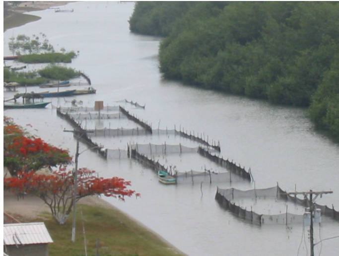
Figura 6. Corrales de engorde de concha prieta ( Anadara tuberculosa ), Isla Costa Rica, 2007.

La Universidad Técnica de Machala a través de la Facultad de Ciencias Agropecuarias está apoyando con la Coordinación Técnica que se encarga del manejo del ecosistema de manglar de la isla Costa Rica y realiza las siguientes actividades: