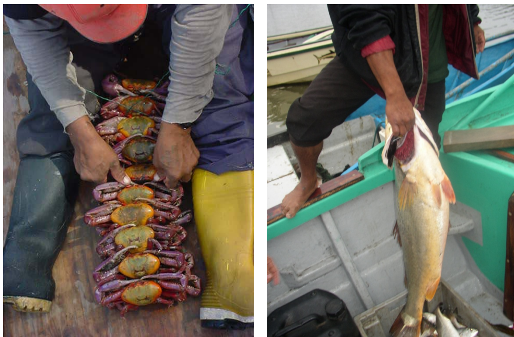
Figuras 2-3. Mariscos capturados en el hábitat marino de la isla Costa Rica, 2007.