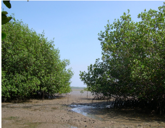
Figura 1. Foto de árboles de mangle rojo (isla Costa Rica), 2007.

La diversidad de especies de mangle es alta en muchas regiones del mundo, sin embargo en el Ecuador existen cinco especies: el mangle rojo ( Rizhophora mangle ) y ( Rizhophora harrisonii ); el mangle negro ( Avisenía germinans ); el mangle blanco ( Laguncularia racemosa ); el mangle piñuelo ( Pollíciéra rhizophorae ), y el mangle Jelí ( Conocarpus erectus ).