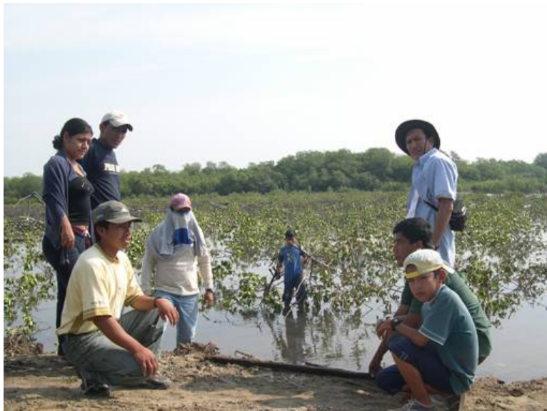
Figura 9. Foto de tala de 10 ha de manglar sector el Cuchillo (isla Costa Rica), 2006.

Se han y se están realizando prácticas estudiantiles con los estudiantes de la Escuela de Acuicultura previa coordinación con los pescadores artesanales de la isla Costa Rica ( Figura 7 ).