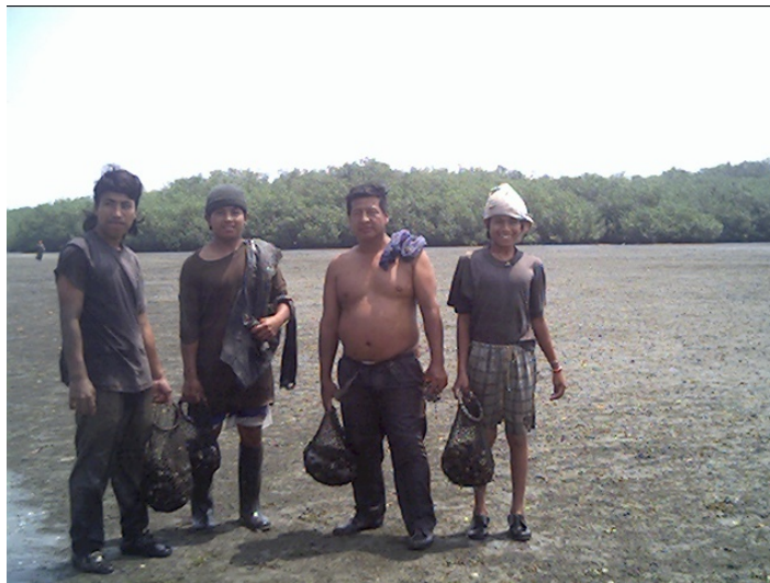
Figura 4. Recolectores de concha de la isla Costa Rica, 2003.

En el decreto ejecutivo 1102 publicado en el Registro Oficial N° 243 el 28 de julio 1999, contiene disposiciones relativas a la protección, conservación y manejo del recurso manglar, entre las cuales se establece el derecho de las comunidades y usuarios ancestrales del manglar a solicitar se les conceda el uso sustentable del manglar para sus subsistencia, aprovechamiento y comercialización de peces, moluscos y crustáceos, entre otras especies que se desarrollan en este hábitat ( Figura 4 ).