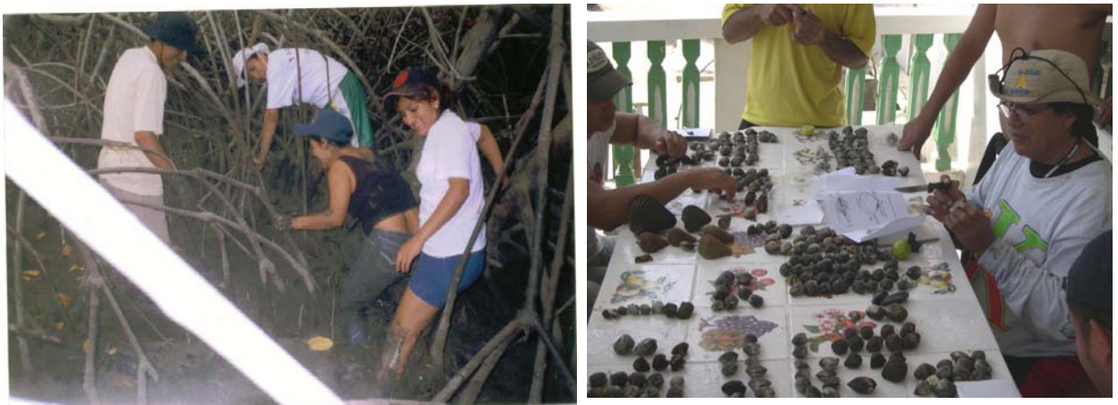
Figura 7-8. Prácticas estudiantiles dentro y fuera del ecosistema manglar (isla Costa Rica), 2005.

Trabajar con los estudiantes a través de pasantías, prácticas estudiantiles de campo y realización de tesis de grado sobre este ecosistema.