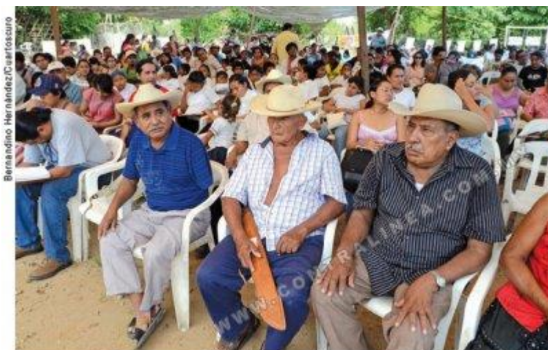
Cinco megaproyectos de presas e hidroeléctricas despojarán de sus tierras a más de 58 mil personas y afectarán indirectamente a otras 162 mil. En la imagen, perjudicados por las obras, reunidos en la séptima edición de la Asamblea Nacional de Afectados Ambientales (comunidad Salsipuedes, Acapulco; julio de 2011)