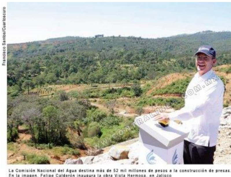
La Comisión Nacional del Agua destina más de 52 mil millones de pesos a la construcción de presas. En la imagen, Felipe Calderón inaugura la obra Vieta Hermosa, en Jalisco