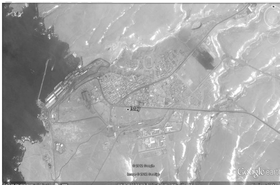
Figura 2. Imagen satelital del puerto de Matarani.