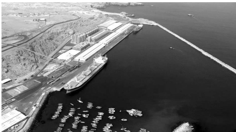
Figura 1. Vista aérea del puerto de Matarani.

de Matarani (ver Figura 1), que se ha venido consolidando como el más importante de la macrorregión sur del Perú, que a la par con el puerto de Ilo es un puerto estratégico para países vecinos del Perú que requieren exportar sus productos y también es un ente conector con los principales países del mundo.