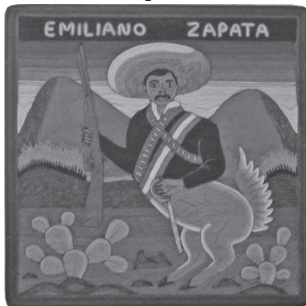
Zapata , de Lucas Matzuwa Castro Jiménez, La Selva Café, Guadalajara, 2012