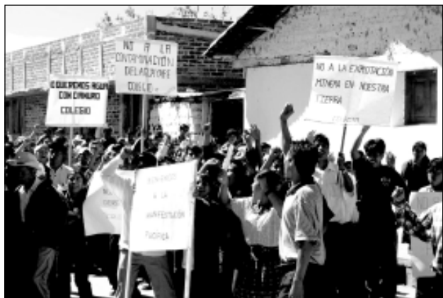
Población de Sipacapa protesta contra mina de oro.

El debate minero en Guatemala y otros países de América Central, puede intensificarse si es que las compañías internacionales, que afrontan una disminución de sus