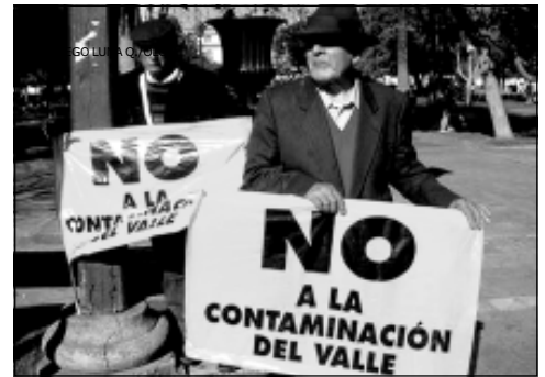
Protesta en La Serena, Chile.

En el proceso participaron los distintos sectores involucrados, entre ellos: gobiernos de los países productores, empresas mineras, organizaciones no gubernamentales, organizaciones de pueblos indígenas, comunidades afectadas, así como organizaciones comunitarias, y el GBM mismo. A nivel de América Latina, se realizó un taller regional