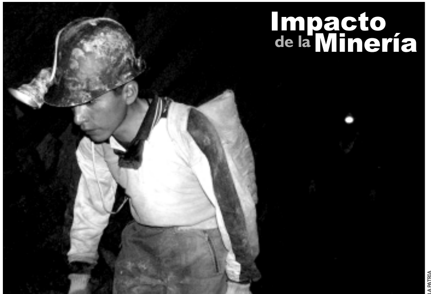
Minero cooperativista boliviano en plena faena.

En el 2004, las exportaciones crecieron en 32% con respecto al año anterior, por un total de US$264 millones. Pero el porcentaje de inversión para mitigar el daño