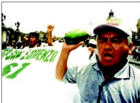
GUJARANGOCINE Y VIDEO

Si bien sus miembros no tienen la obligación de aplicar alguna recomendación, se espera que el conocimiento del otro y