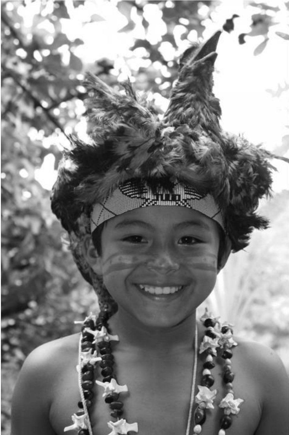
Figure 3 – Jeune danseur Kichwa