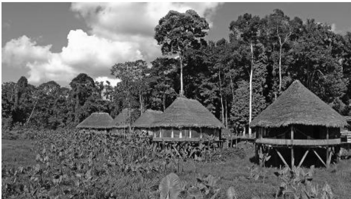
Figura 3 – Cabañas desde la laguna Kapirnamamus

13• El lodge consta de veinte habitaciones construidas sobre pilotes a orillas de una laguna con abundante vegetación y aves. Están hechas con materiales de la zona (madera, lianas y hojas de palma) y respetan las formas tradicionales de construcción de los achuar (de forma elíptica) (véase figura 3).