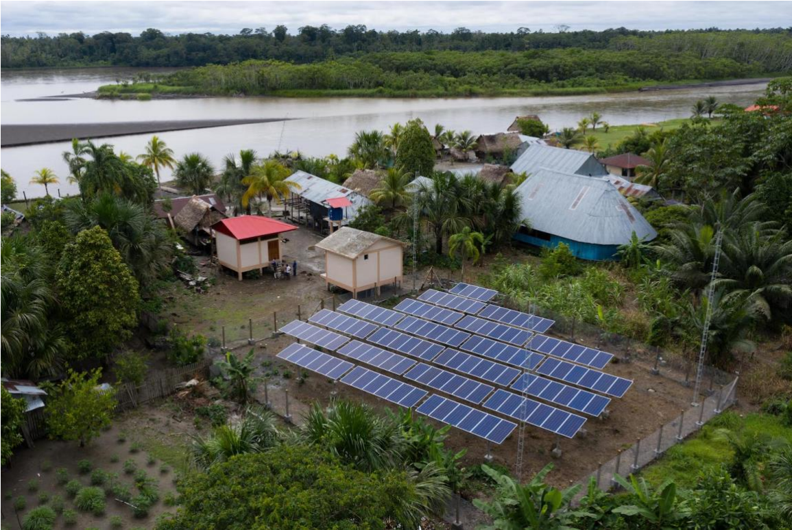
Paneles fotovoltaicos en la comunidad Kandozi de San Fernando.

“La implementación de las plantas de hielo se ha dado como parte de un proyecto que busca crear bionegocios basados en la energía solar en la región amazónica,” explica Meneses. Detalla que el proyecto ejecutará nueve bionegocios. Cuatro de ellos están ya operando o en fase piloto en cuatro comunidades ancla, brindando beneficios a las comunidades amazónicas aledañas.